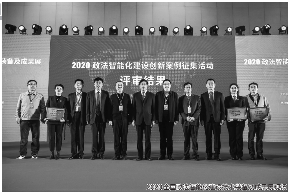
2020全国政法智能化建设技术装备及成果展现场

智慧一站式送达服务平台,是海口龙华区法院为了提升审判质效,依托中国联通大数据及其服务,为审判工作提供“托底式”文书送达服务,建立“审送分离”新模式,率先在全省开启“一键点击”六种送达方式的工作模式,实现送达工作线上线下全流程智能化操作,保障送达程序的畅通,缩短送达时间,提升审判质效。根据统计,智慧一站式送达服务平台的启用,有效缩短案件平均送达时长和外